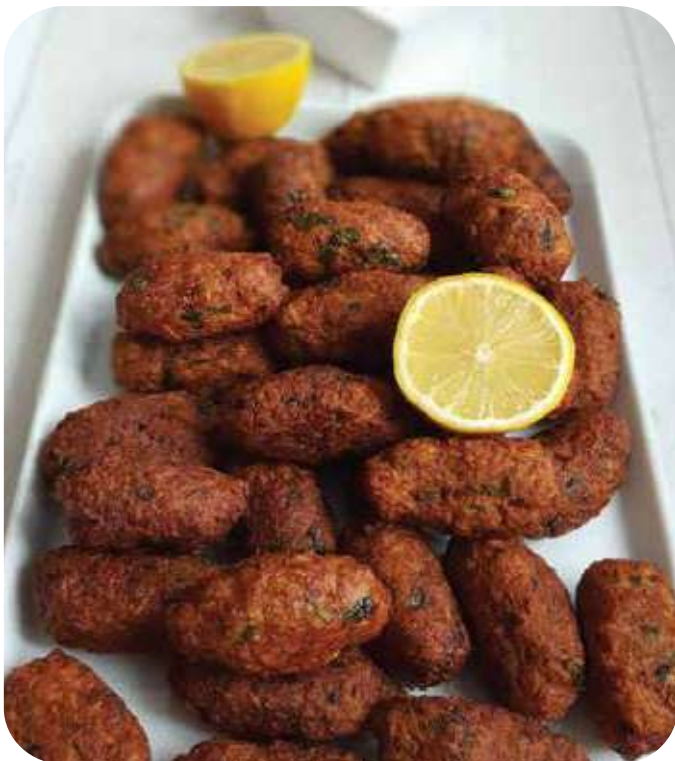
CYPRUS KEFTEDES / INT. CODE: 3338