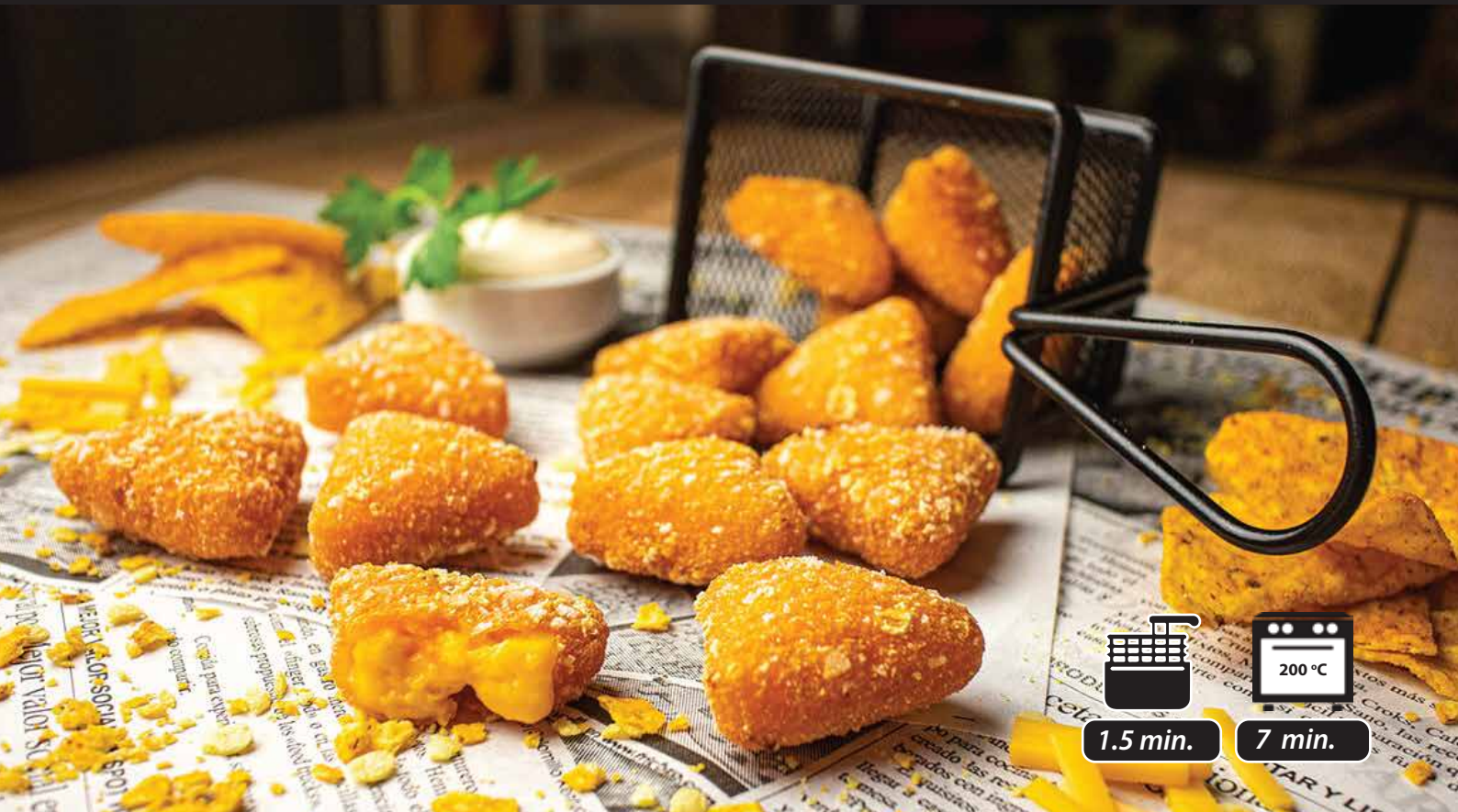
CHEESE NACHOS / INT. CODE: 4486