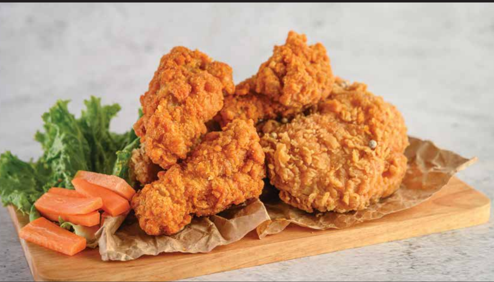
CHICKEN WINGS CRISPY & SPICY / INT. CODE: 3339