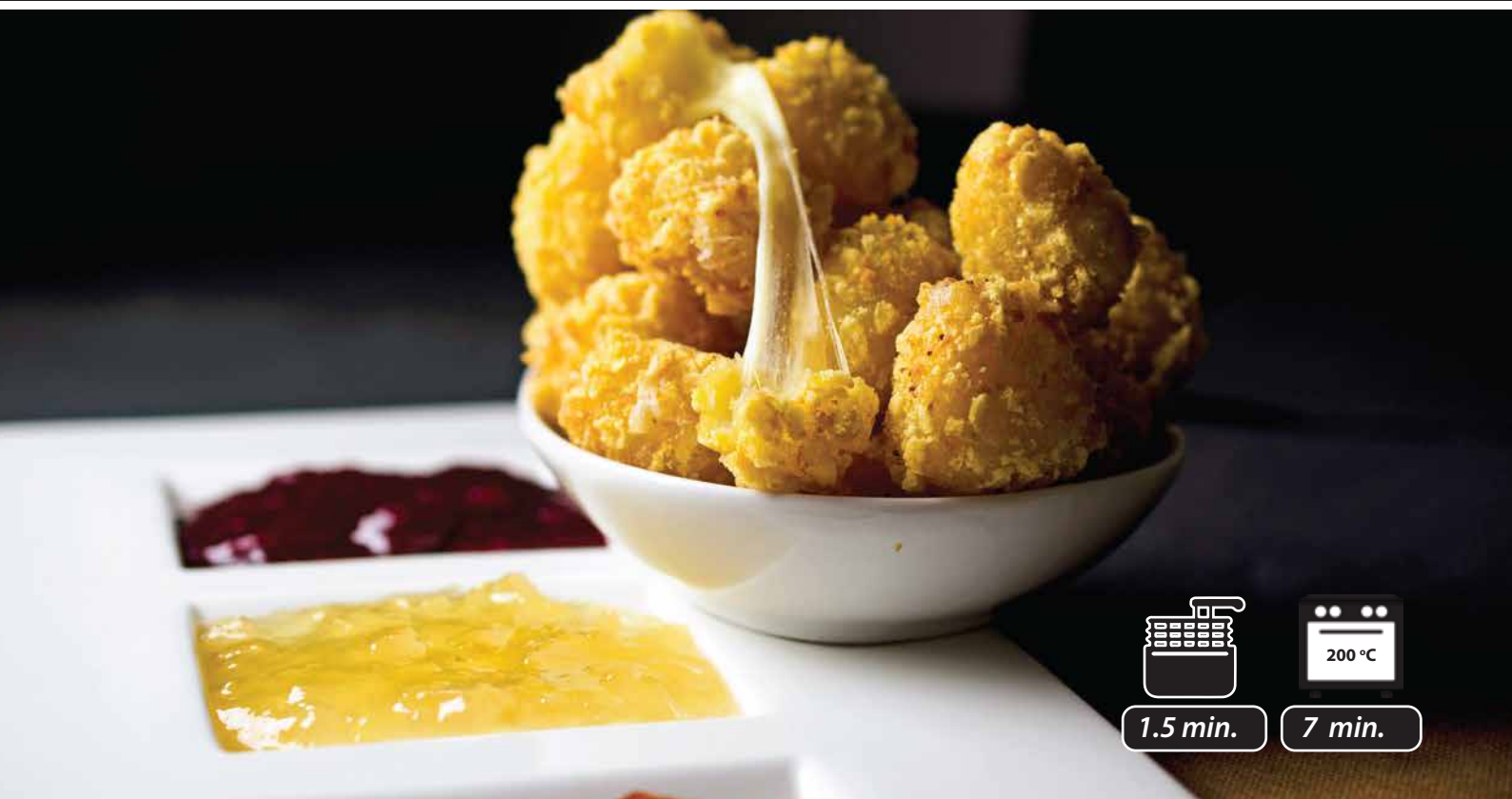
CHEESE POPS GOUDA / INT. CODE: 4413