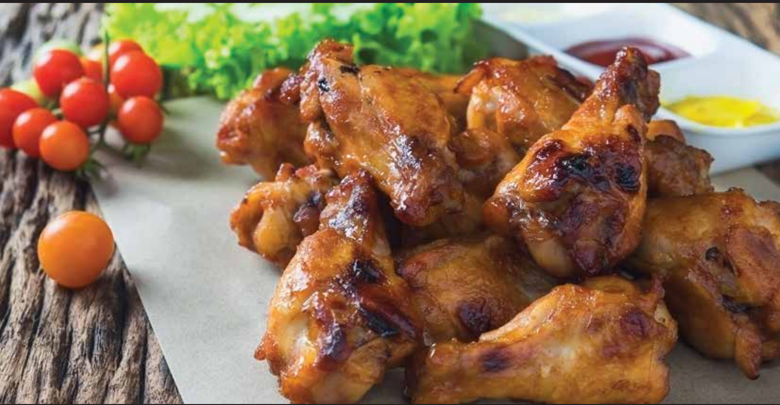
CHICKEN WINGS BBQ / INT. CODE: 6614