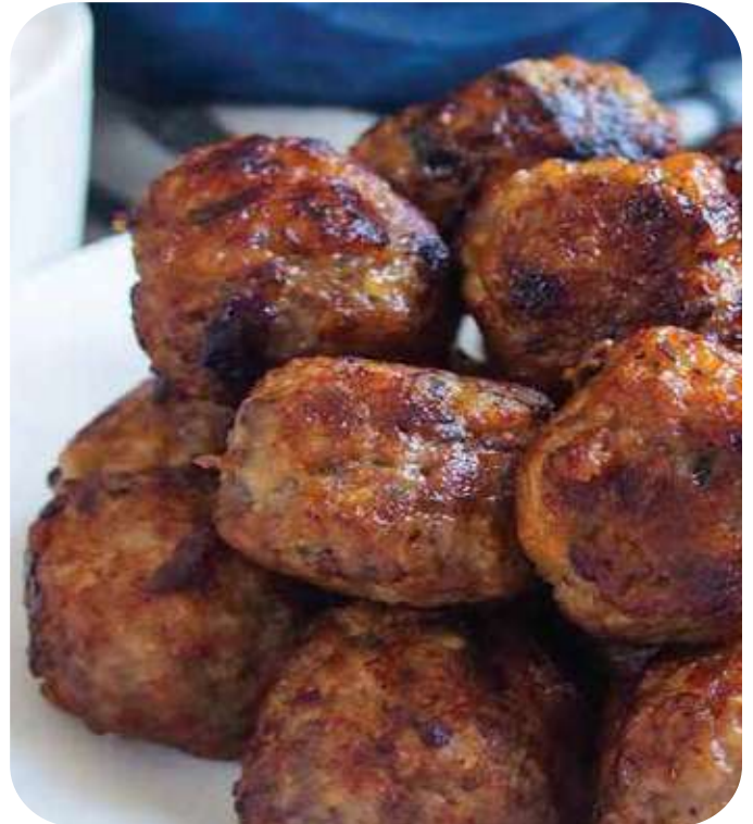
MEAT BALLS / INT. CODE: 3335